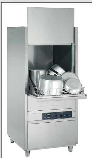
Töpfe in der Spülmaschine