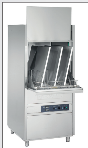
Bleche in der Spülmaschine